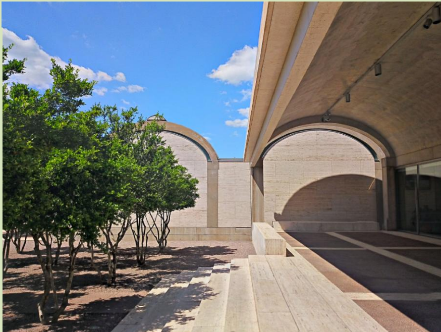
L. Kahn

La lumière est la raison d'être de l'architecture, elle en constitue le premier matériau. Sans elle, le mur, l'espace, l'ombre n'existent pas. Depuis des siècles, les architectes la manipulent, des temples dédiés au Dieu Soleil en passant par les flammes du Gothique jusqu'aux expériences technologiques récentes. Au-delà de la « lumière éclairage » qu'a amenée la révolution industrielle, il est question de la « lumière émotion ». Où, en la qualifiant, en combinant les qualités (directe, réfléchie, zénithale, chaude, claire, solide...), en l'abordant de manière artistique plus que technique ou quantitative, les plus beaux espaces de l'histoire de l'architecture ont vu le jour. Aujourd'hui, si l'éclairage artificiel est maîtrisé dans ses dispositifs les plus sophistiqués, la lumière naturelle, solaire, du « Bon Dieu » -Le Corbusier-, tend à être oubliée dans l'architecture. Il semblerait que ce soit pourtant « la seule (...) qui fasse l'architecture être architecture » - Louis Kahn-. Nous retiendrons une sélection d'édifices où la lumière est mise en œuvre de manière sensible et poétique pour tour à tour permettre la fascination, le recueillement et la sérénité des hommes.